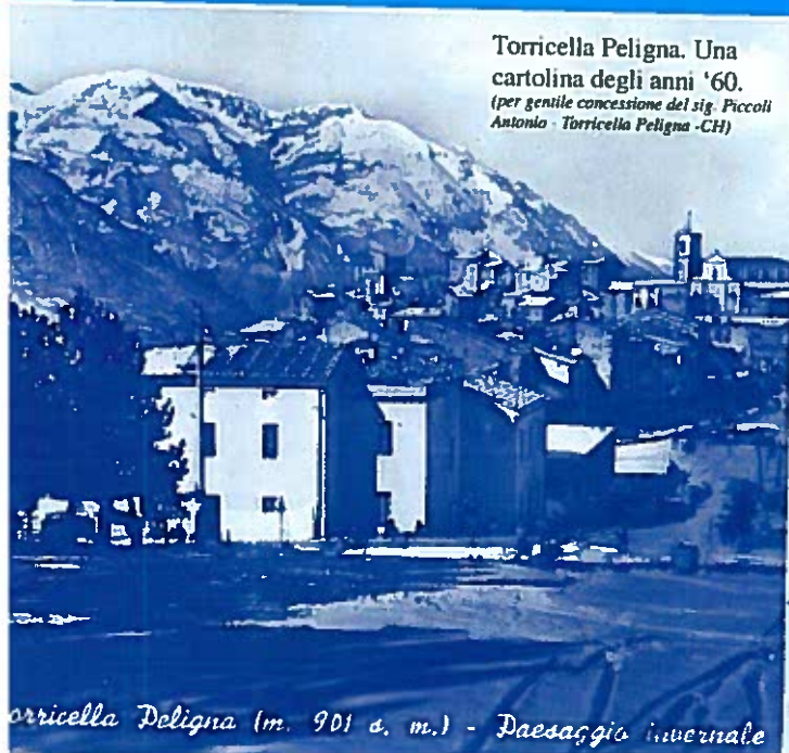
Torricella Peligna (m. 901 s. m.) - Paesaggio invernale

Torricella Peligna. Una cartolina degli anni '60.